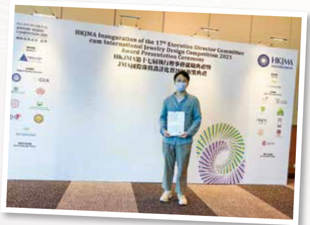
▲ 獲獎者參與JMA香港國際珠寶節