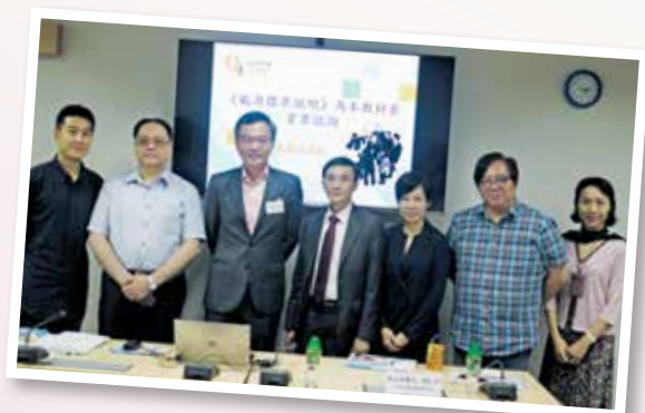
▲ 安老服務業《能力標準說明》為本教材套業界諮詢簡介會 (2017年5月)