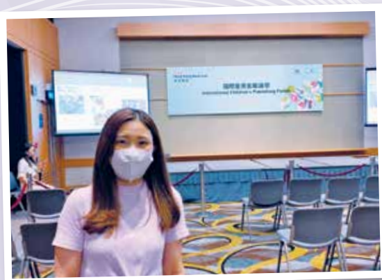
▲ 獲獎者參與國際童書出版論壇