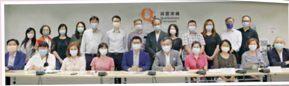
▲ 現屆安老服務業行業培訓諮詢委員會 (2021年5月)