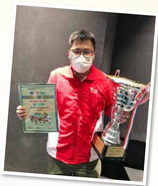
▲ 獲獎者參與職安健常識問答比賽2022