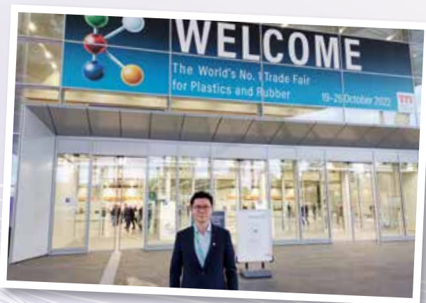
▲ 獲獎者參與K International Trade Fair 2022