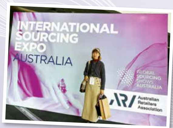
▲ 獲獎者參與澳洲國際採購展覽會