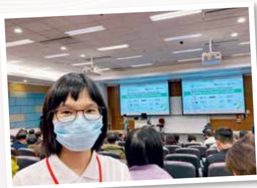
▲ 獲獎者參與香港老年學會第28屆老年學週年會議