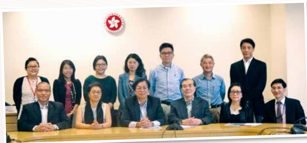
▲ 第二屆保安服務業行業培訓諮詢委員會 (2015 年 4 月)