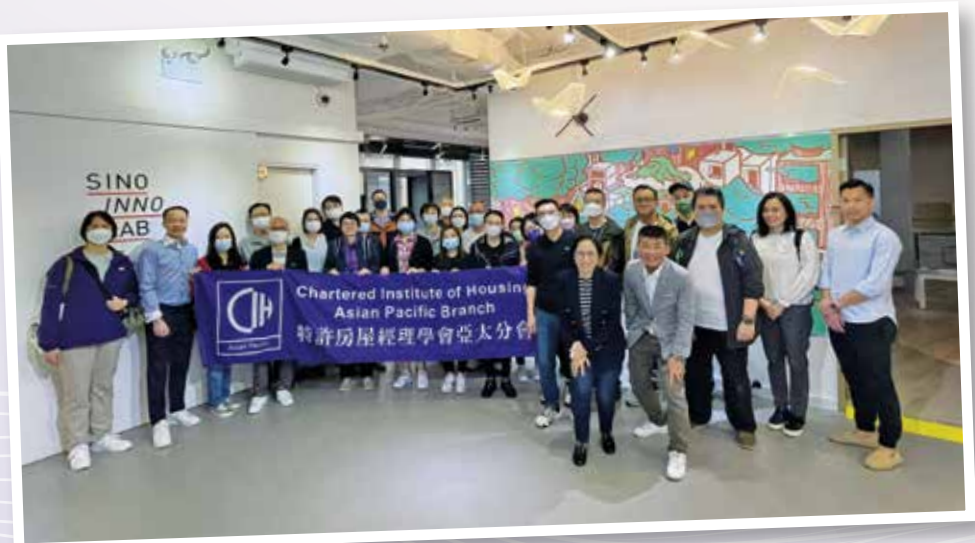
▲ 獲獎者參與信和創意研發室參觀活動