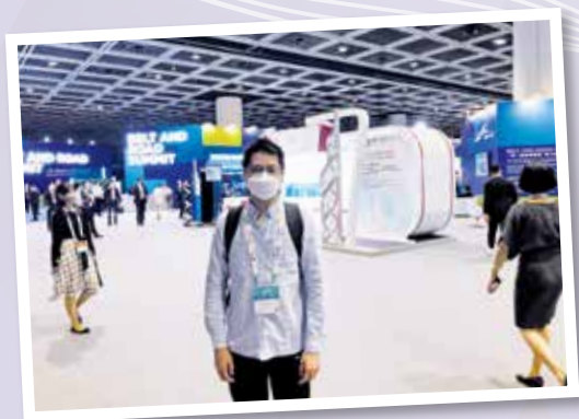
▲ 獲獎者參與「一帶一路」高峰論壇