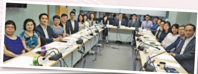
第四屆安老服務業行業培訓諮詢委員會 (2018年4月) ▶