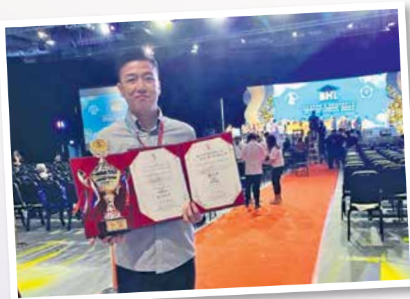
▲ 獲獎者參與IBH國際技能匯演大賽