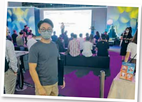
▲ 獲獎者參與亞洲鐘錶研討會2021