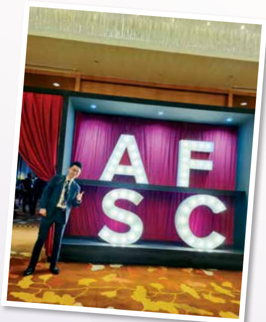
▲ 獲獎者參與IDC Asian Financial Services Congress 2023