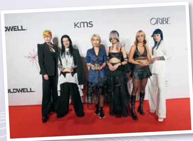
▲ 獲獎者參與Kao Salon Division Global Creative Awards 2022