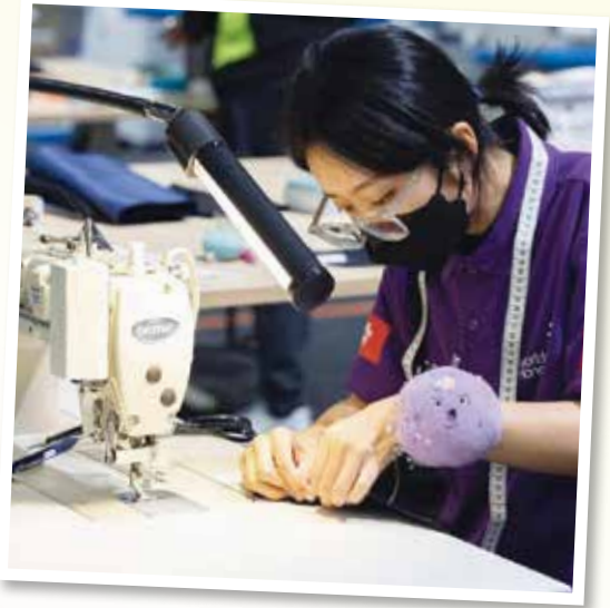
▲ 獲獎者參與2022年世界技能大賽特別賽