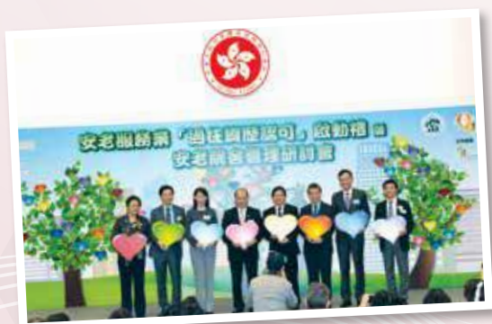
▲ 安老服務業「過往資歷認可」啟動禮暨安老院舍管理研討會 (2015年10月)