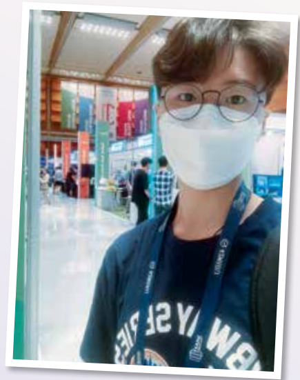
▲ 獲獎者參與Smart Tech Korea 2022