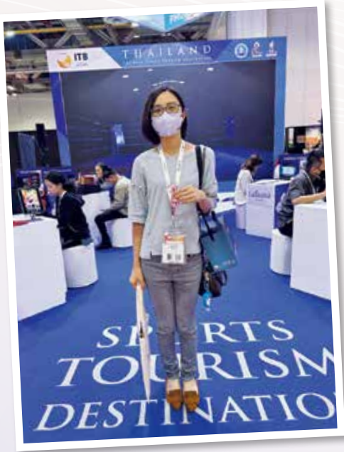
▲ 獲獎者參與ITB Asia 2022