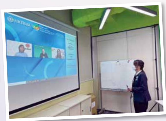
▲ 獲獎者參與香港零售高峰會 2022