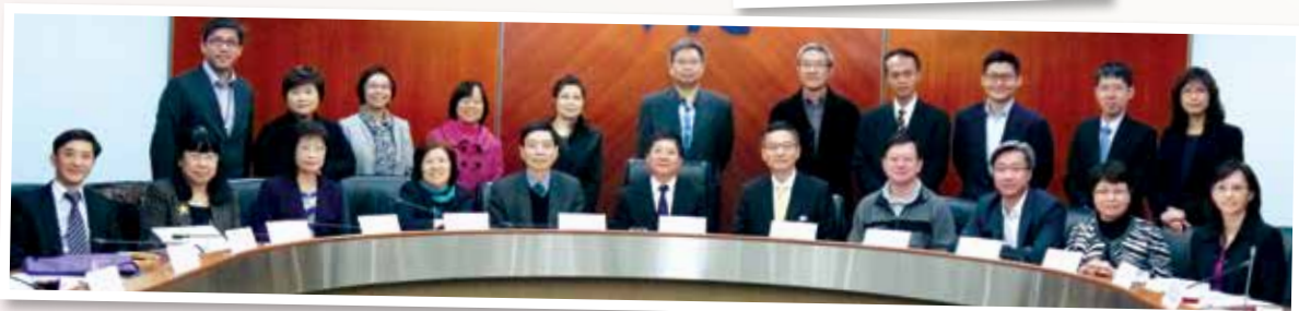
▲ 第二屆安老服務業行業培訓諮詢委員會 (2015年3月)