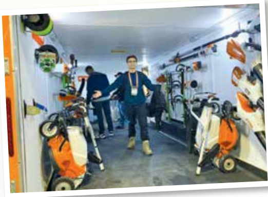
▲ 獲獎者參與加拿大安大略省園景會議