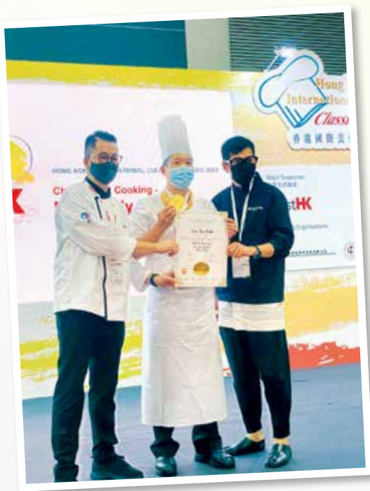
▲ 獲獎者參與第19屆HOFEX亞洲頂尖國際食品餐飲及酒店設備展