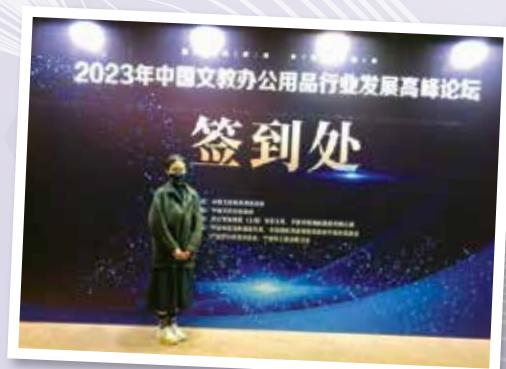
▲ 獲獎者參與中國(寧波)國際文具禮品展覽會