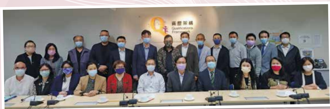
▲ 上屆保安服務業行業培訓諮詢委員會 (2021 年 11 月)