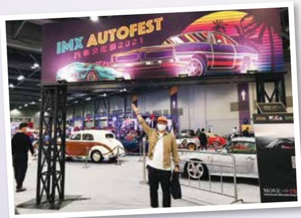
▲ 獲獎者參與香港國際汽車博覽 2021