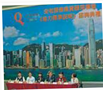
安老服務業資歷架構暨《能力標準說明》諮詢典禮 (2014年4月)