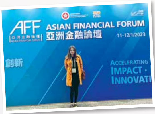
▲ 獲獎者參與亞洲金融論壇2023