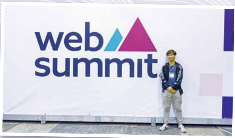
▲ 獲獎者參與Web Summit 2022