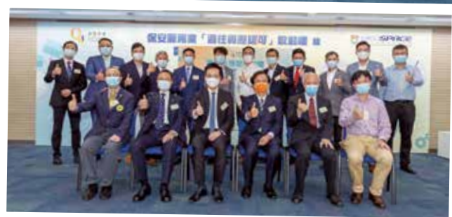
▲ 保安服務業「過往資歷認可」啟動禮暨香港保安從業員日慶祝活動 (2021 年 7 月)